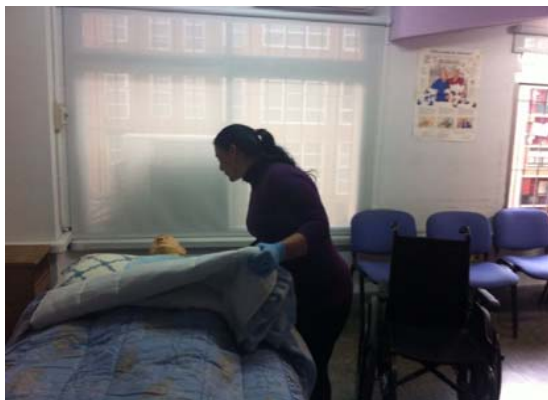
Módulo Cuidado de Personas Dependientes

El acompañamiento integral de la persona y la atención socio-educativa prestada por personal cualificado técnicamente, se sustenta en planes individuales de atención /intervención (PIA) que responden a las necesidades de cada persona usuaria.